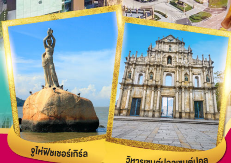
จูไห่ฟิชเชอร์เกิร์ล