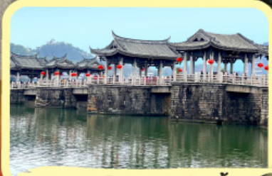
• สะพานโบราณกว่างจี