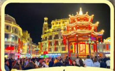
• ถนนโบราณเสี่ยวกงหยวน