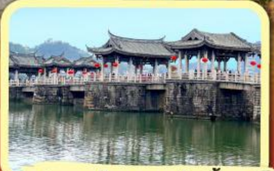
• สะพานโบราณกว้างจี้