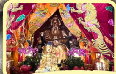
• เอียงบู๊ซิว (ศาลเจ้าพ่อเสือ)