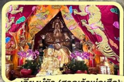
• เอียงมูซิว (ศาลเจ้าพ่อเสือ)