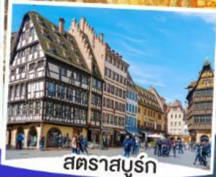
สตราสบูร์ก