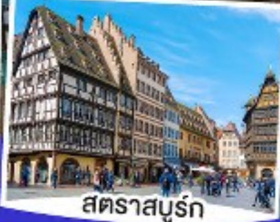
สตราสบูร์ก