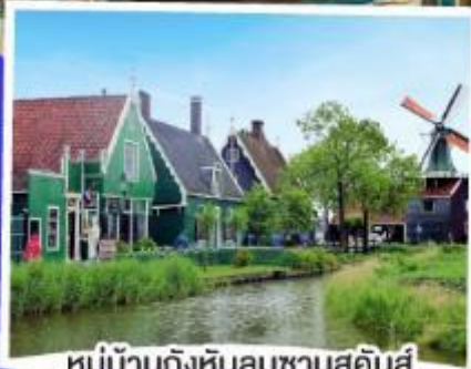
หมู่บ้านกังหันลมซานสคินส์