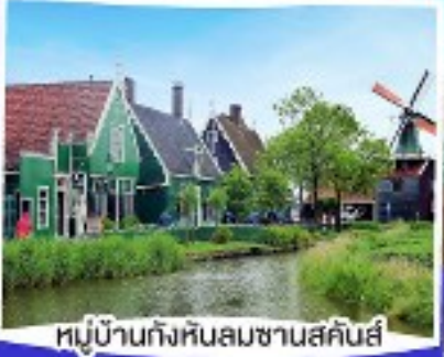
หมู่บ้านกังหันลมซานสคินส์