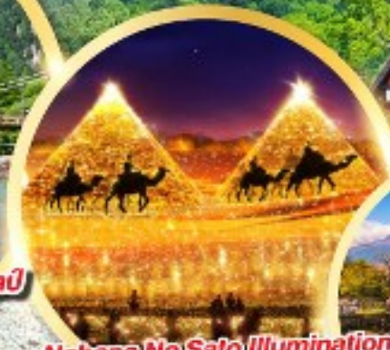
Nabana No Sato Illumination