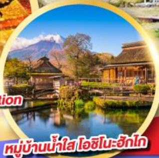
หมู่บ้านน้ำใส โอชิโนะซึกิโก