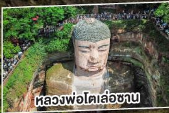
หลวงพ่อโตเล่อซาน