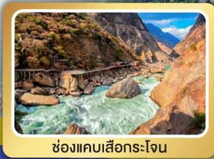
ช่องแคบเสือกกระโจน