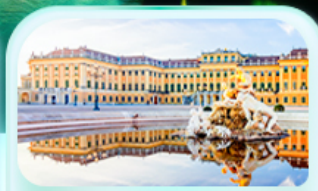
พระราชวังเซินบรุนน์