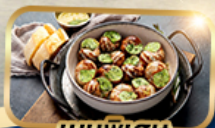
เมนูพิเศษ หอย Escargot