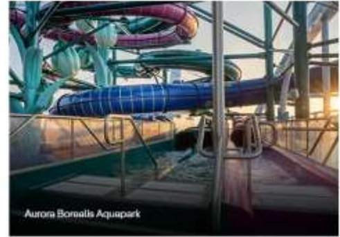
Aurora Borealis Aquapark