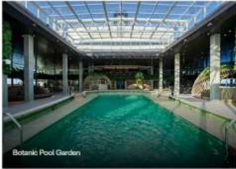
Botanic Pool Garden